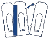
Détacher un suppositoire selon les pointillés

Ce médicament est utilisé par voie rectale.