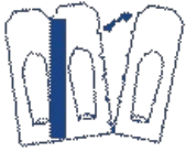
Détacher un suppositoire selon les pointillés

Ce médicament est utilisé par voie rectale.